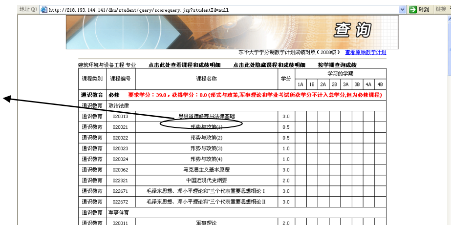
图十二：点击课程名称，查询课程详细信息