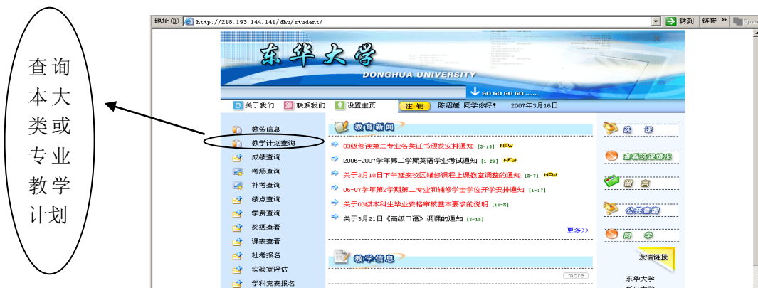
图三：教学计划查询

详细查阅教学计划中“通识教育”、“学科基础”、“专业方向”、“综合实践”、“实践教学”每部分的课程安排，如图四至图八， 学生取得教学计划表中规定的所有学分后方可毕业。