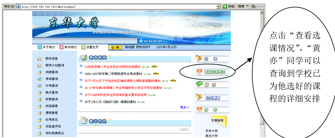
图九：查询学校已为同学选好的课程的详细安排，包括上课时间、地点、任课教师等信息