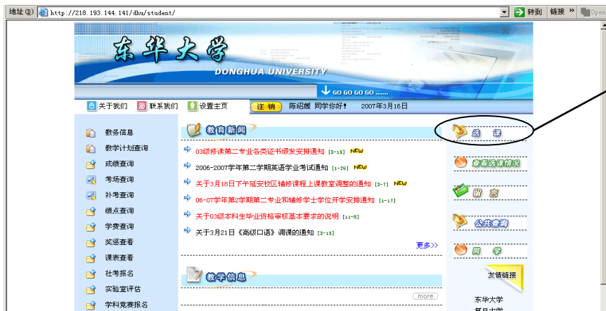
图十：点击“选课”进入选课界面

点击本专业教学计划中的“数学类”、“大学英语类”及“计算机类”，可查询到第一学期数学类、大学英语类、计算机类、体育类开设课程。